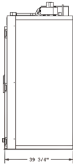
DIMENSIONS DE L'APPAREIL PPR2-4S